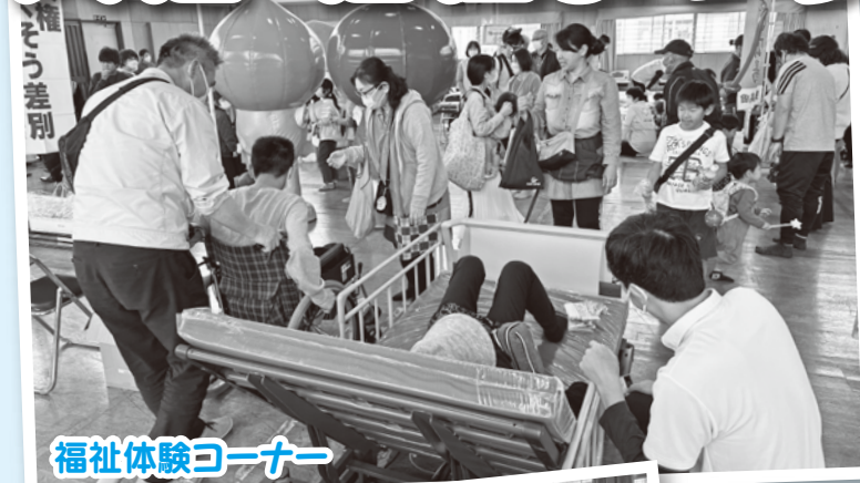
福祉体験コーナー

3月12日(日)、豊後高田市隣保館・児童館、高田小学校体育館で4年ぶりに人権・福祉まつりが開催されました。福祉体験コーナー等を設置して、たくさんの方に車いすや介護ベッドを体験していただきました。