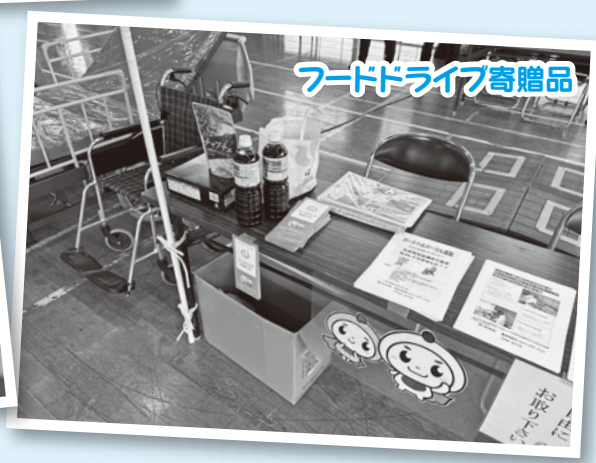
フードドライブ寄贈品