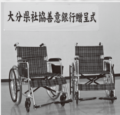
大分県社協善意銀行贈呈式