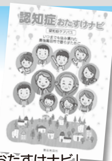
豊後高田市「認知症おたすけナビ」 (認知症ケアパス) P3より

認知症の状態に応じて、どこへ相談し、どのようなケアやサービスが受けられるかを取りまとめたものです。パンフレットは、市の相談窓口や、地域包括支援センター等に置いています。