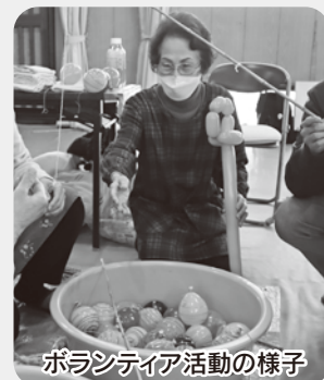
ボランティア活動の様子

これを契機にして、引き続きボランティア活動に貢献できるよう頑張ってお参りたいと思います。」