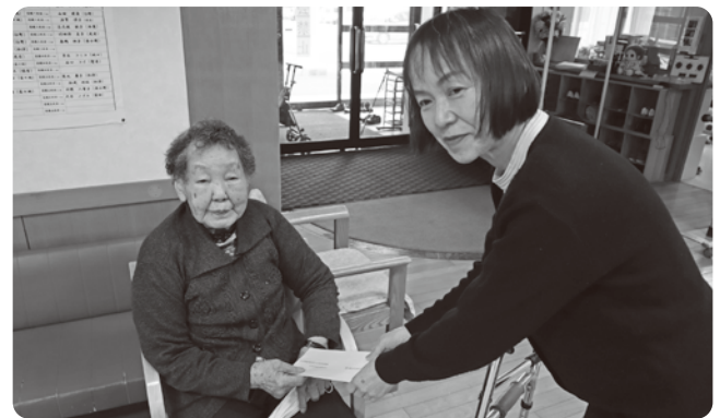
社協職員による見舞金のお渡し