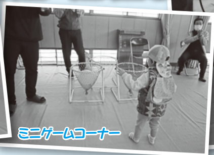
ミニゲームコーナー