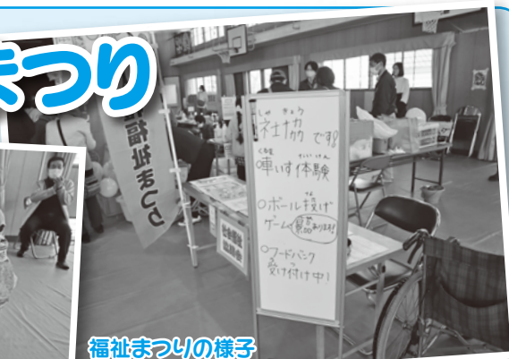
福祉まつりの様子

3月9日(日)、豊後高田市隣保館・児童館、高田小学校体育館で人権・福祉まつりが開催されました。社会福祉協議会ではフードバンク受付や福祉体験、ミニゲームコーナーを設置して、たくさんの方にフードバンクへ寄付をいただき、車いす体験やゲームに参加していただきました。ありがとうございました。