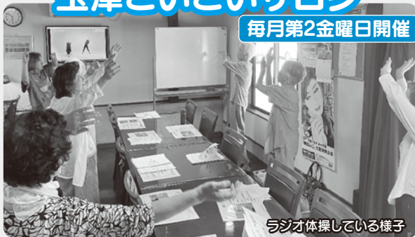
ラジオ体操している様子

玉津こいこいサロンでは、体操や運動を行い、元気に体を動かしています。また、みんなで歌を歌ったり、おしゃべりなど楽しい時間を過ごしています。