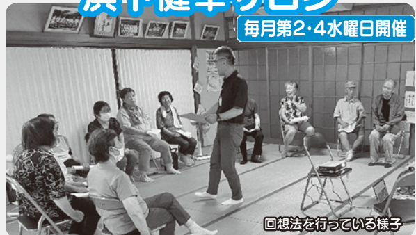
回想法を行っている様子

浜下健幸サロンでは、毎年お花見や盆踊りなど季節に合わせた計画をしており、皆さん笑顔で、楽しく元気に活動しています。