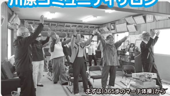
まずは「365歩のマーチ体操」から

川原コミュニティサロンは、毎月第3水曜日に体操の後に、社協や市による講話を実施しています。