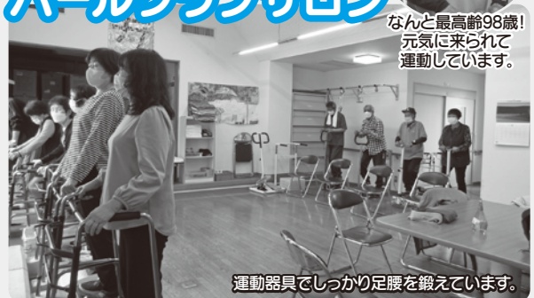
運動器具でしっかり足腰を鍛えています。