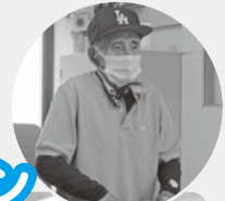
なんと最高齢98歳! 元気に来られて 運動しています。