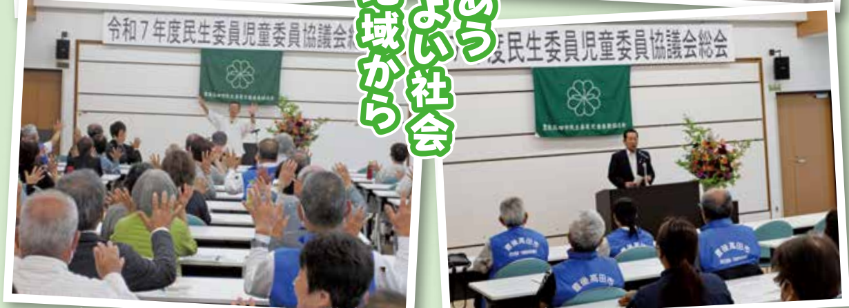
民生委員・児童委員4部会合同研修会