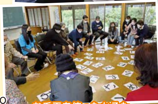
お手玉を使ったかるた