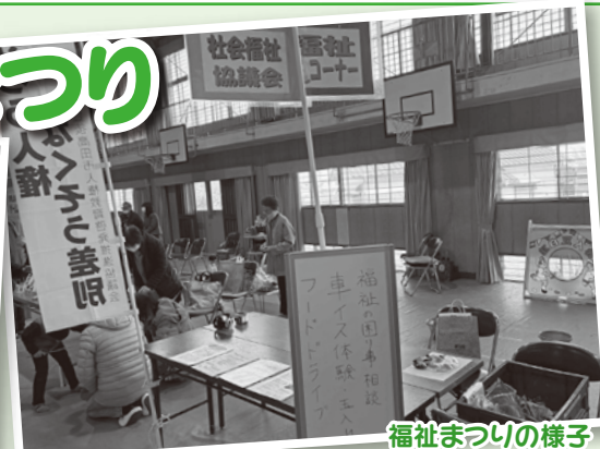
福祉まつりの様子

3月8日(日)豊後高田市隣保館・児童館、高田小学校体育館で人権・福祉まつりが開催され、社会福祉協議会はフードドライブ、福祉の相談や体験、ミニゲームコーナーを設置しました。たくさんの方にお越しいただき、車いす体験やゲームに参加していただきました。ありがとうございました。