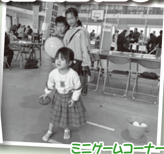
ミニゲームコーナー