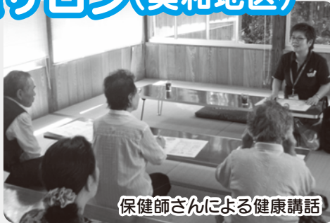
保健師さんによる健康講話

「向鍛治屋サロン」は毎月第1金曜日午前10時から向鍛治屋貴船神社社務所で活動しています。お気軽にご参加ください。