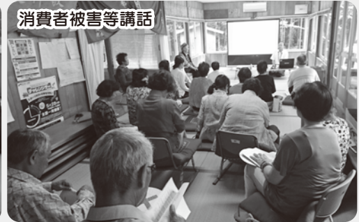
消費者被害等講話