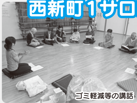
ゴミ軽減等の講話