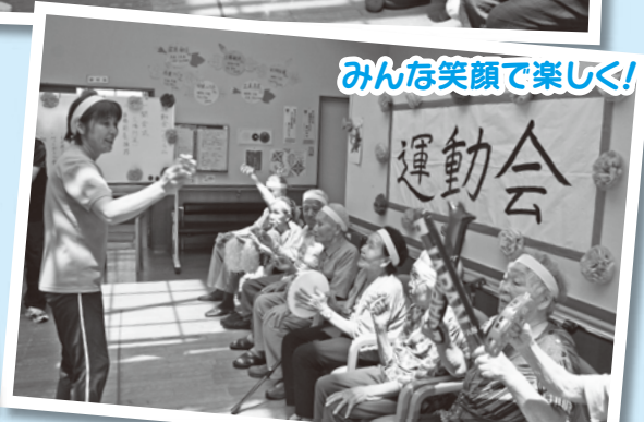
みんな笑顔で楽しく!