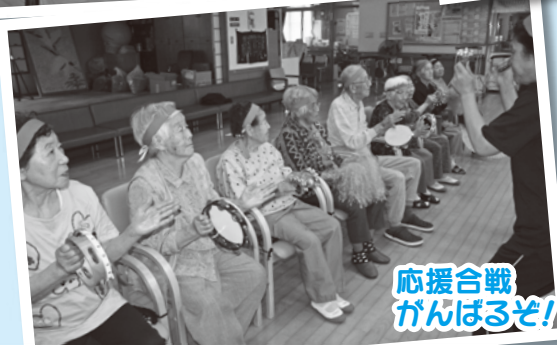
応援合戦 がんばるぞ!