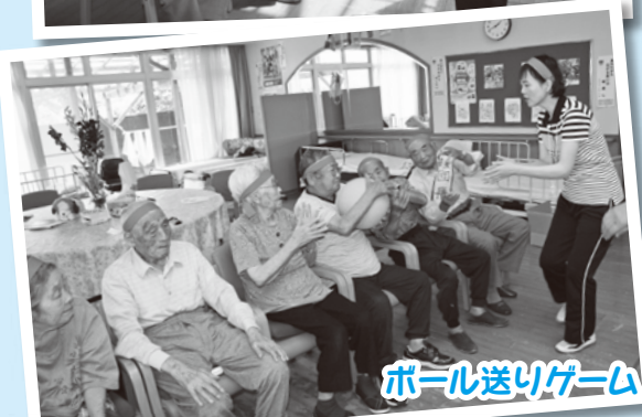
ボール送りゲーム