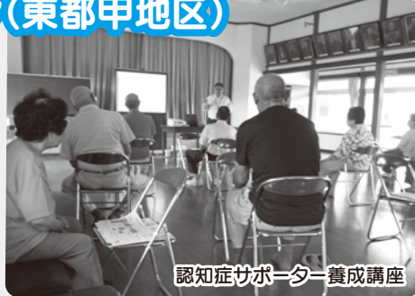
認知症サポーター養成講座

「東都甲サロン」は毎月22日の午前10時30分から東都甲公民館で活動しています。皆さんでレクリエーションや講習会などを行っています。お気軽に参加してください。