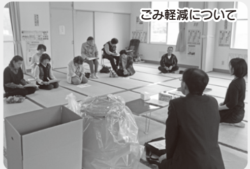
ごみ軽減について