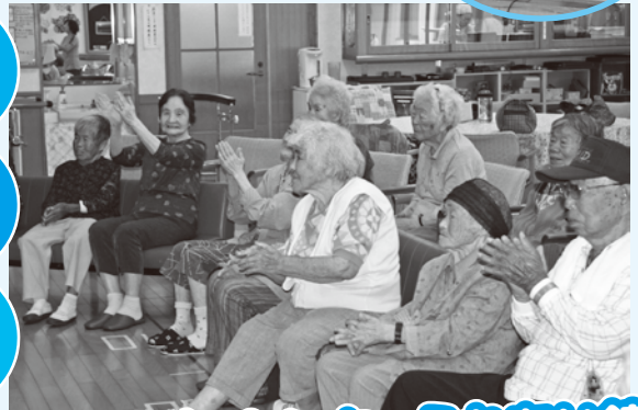
デイサービスセンター-周防苑