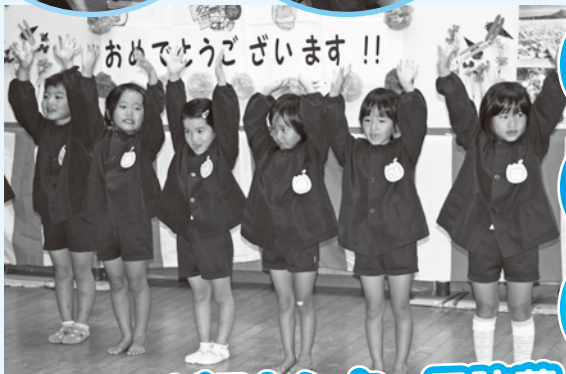
おめでとうございます!!