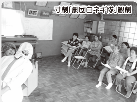
寸劇「劇団白ネギ隊」観劇