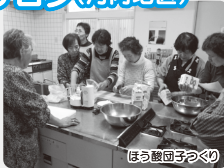
ほう酸団子づくり

「西川丸山サロン」は毎月第2火曜日午前10時から河内公民館で活動をしています。皆さんでレクリエーションなどを行っています。お気軽に参加してください。