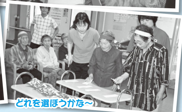
どれを選ぼうかな～