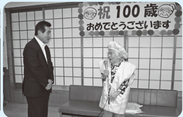
祝 100歳 おめでとうございます