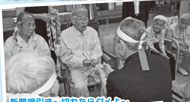
新聞綱引き～切れたらダメよ～

6月下旬にデイサービスの運動会が行われました。紅白に分かれ、皆さん楽しんで競技に参加していました。