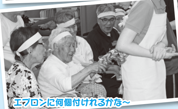
エプロンに何個付けれるかな～