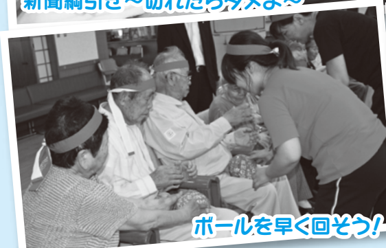
ボールを早く回そう！