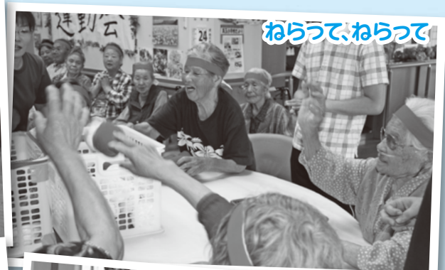
ねらうて、ねらうて