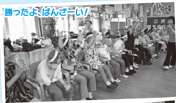
勝ったよ、ばんざーい！