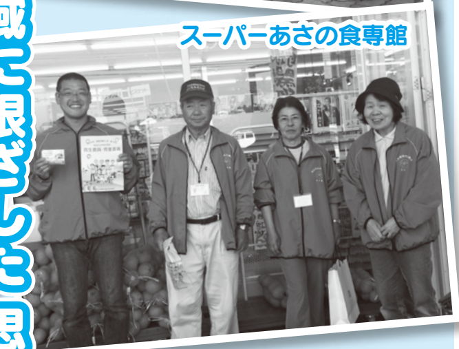
スーパーあさの食専館