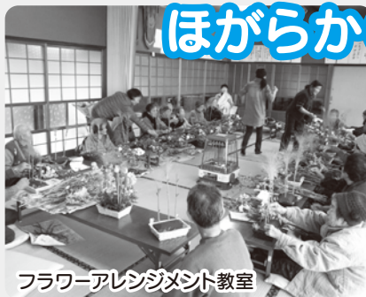
フラワーアレンジメント教室