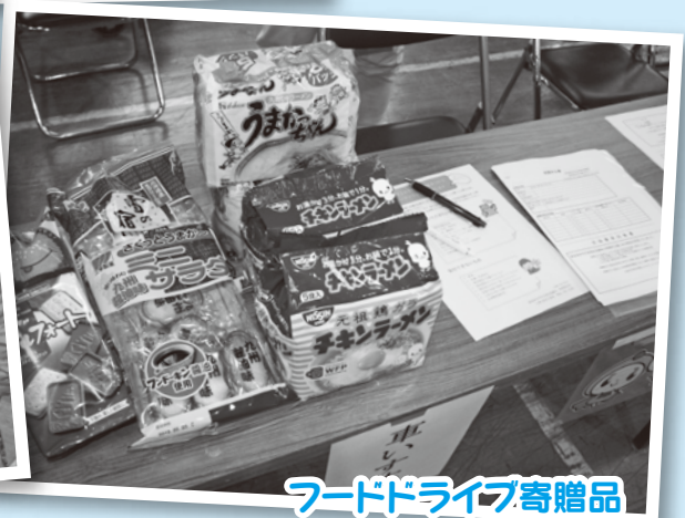
フードドライブ寄贈品