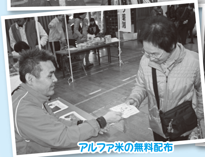
アルファ米の無料配布

また、今回もフードドライブを実施して、地域の方々から、お菓子やインスタント食品等を寄贈していただきました。ご協力ありがとうございました。