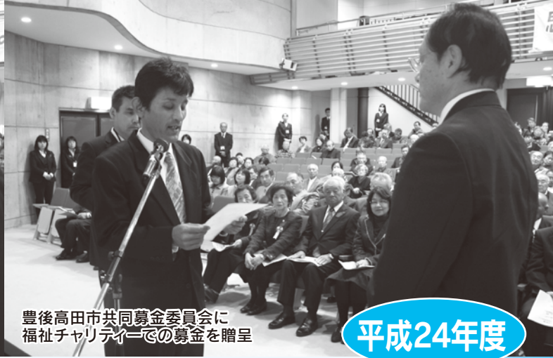
豊後高田市共同募金委員会に 福祉チャリティーでの募金を贈呈