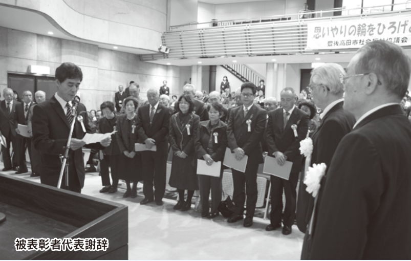
被表彰者代表謝辞