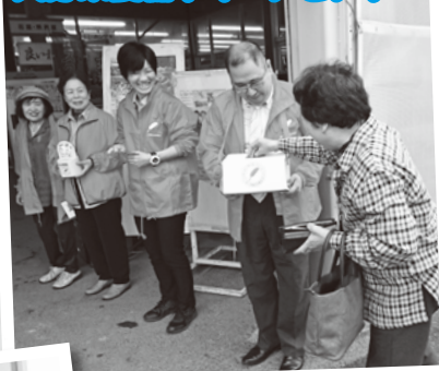
大分県農協グリーンセンター