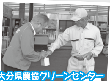
大分県農協グリーンセンター