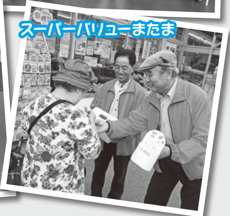
スーパーバリューまたま