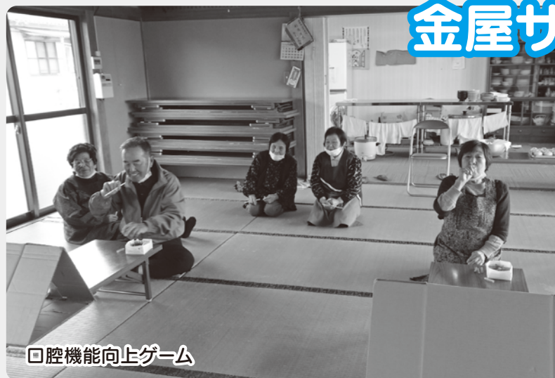
口腔機能向上ゲーム