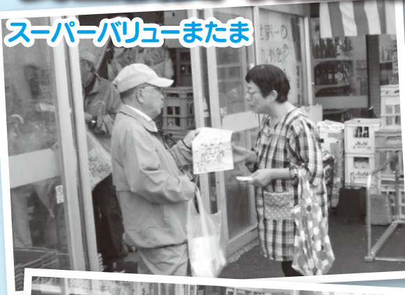
スーパーバリューまたま